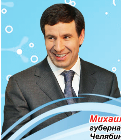
Михаил ЮРЕВИЧ, губернатор Челябинской области