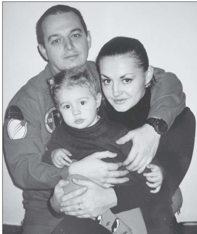
«Полететь в космос было нашей общей мечтой, вот только мы не знали, сбудется ли она», — признается Елена Серова.